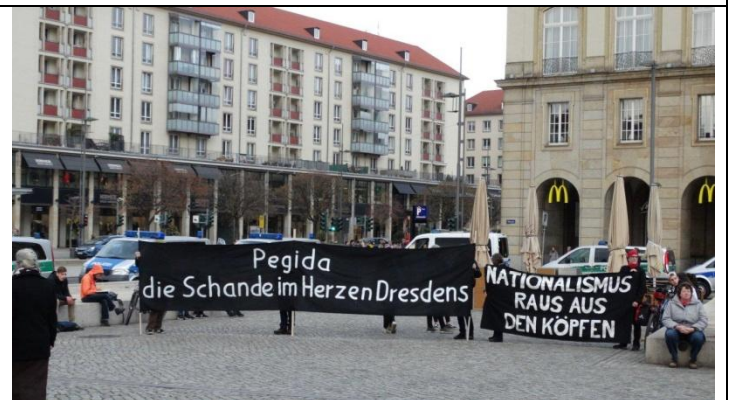
Die Polizei schützt mit Wagenburgen die PAGIDA vor den gewaltbereiten Mob.