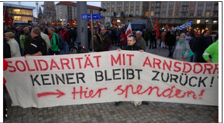
Am 24. April bahnt sich im Landkreis Bautzen das nächste Justizverbrechen an. Die ersten Proteste sind bereits angekündigt. https://einprozent.de/post/2033