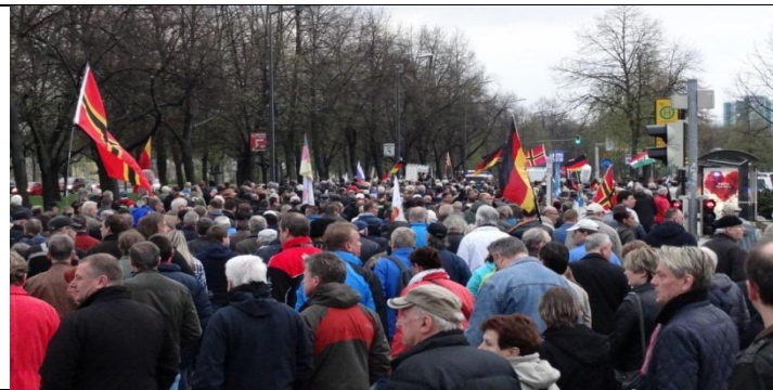
Das sind die (noch) friedlichen Spaziergänger von PEGIDA. Ein Patriot hielt die Zeit fest. Der Vorbeilauf dauerte 40 Minuten. Wieviel Patrioten werden es wohl gewesen sein?