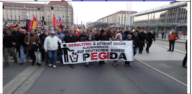
Das ist die Spitze der Spaziergänger.

Die Menschen drücken ihren Haß auf das System mit dafür nicht zur